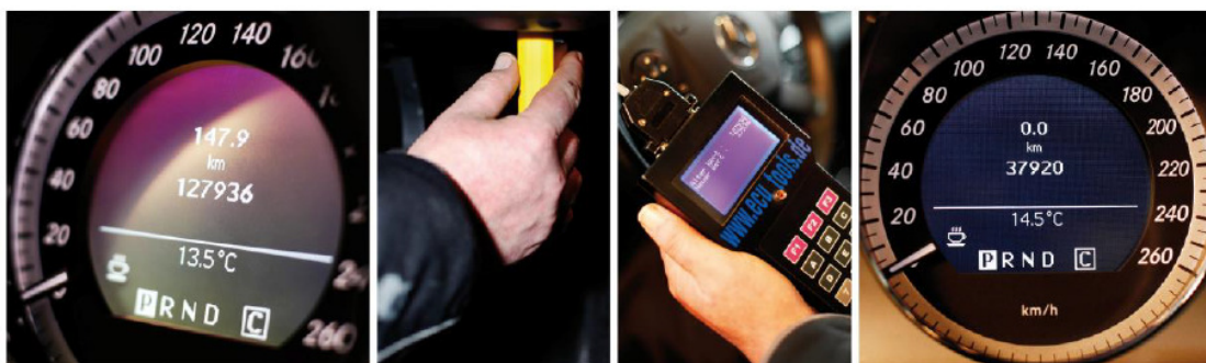
Pas 1 Quilòmetres originals